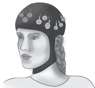
ILUSTRACIÓN 2. Aunque las descripciones verbales siguen siendo una valiosa herramienta, gran parte de la investigación actual se basa en el uso de electroencefalogramas (EEG), imágenes por resonancia magnética funcional (IRMf) y tomografía por emisión de positrones (PET) para determinar los circuitos neuronales que participan en el sueño. Aquí, una mujer con un casco de EEG para un estudio.

Este método me permite tomarme en serio los datos empíricos al tiempo que me planteo preguntas filosóficas fundamentales sobre qué significan. Porque, tal como veremos, su significado está ahí para quien quiera verlo 20 .