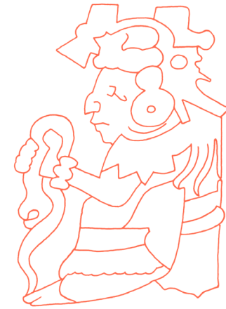
Imagen de Gucumatz o Serpiente Emplumada.

A las aves grandes y a las pequeñas, se les dijo: «Sobre los árboles haréis vuestros nidos, vuestras moradas, y allí mismo os reproduciréis. Cuando os mojéis con las lluvias, sacudíos las plumas sobre las ramas de los árboles y los bejucos».