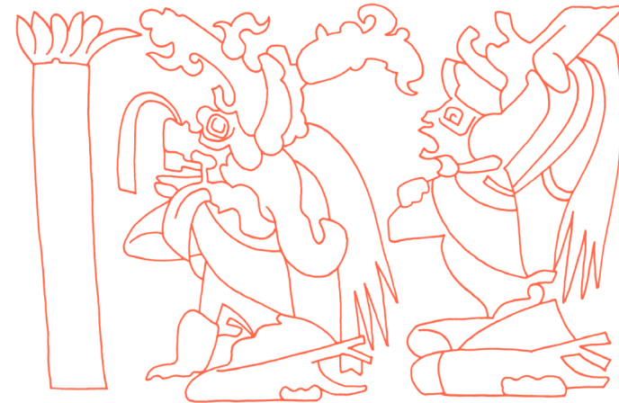
Reunión de los dioses creadores de la Tierra.

La primera manifestación fue la de Caculhá Huracán; la segunda, la de Chipí Caculhá, que es el más pequeño de los rayos; la tercera, la de Raxá Caculhá, el Rayo Verde, que es por medio de quien se comunica Corazón del Cielo con Tepeu y con Gucumatz.